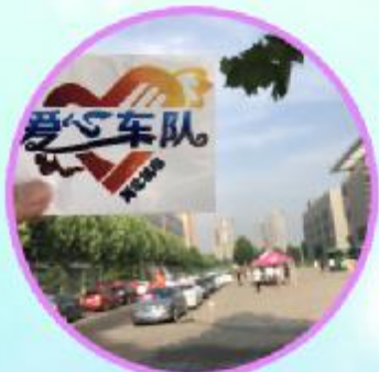
送别爱心车队 (曹小兵 摄)