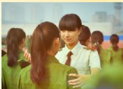
教官情 (谭亮 摄)