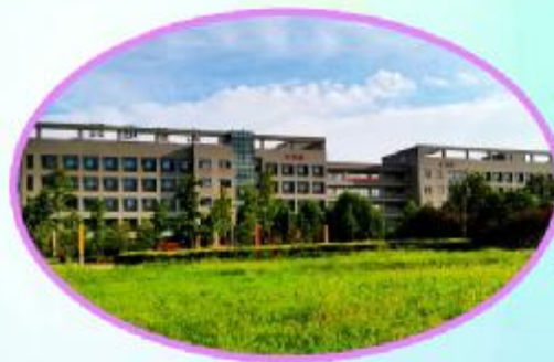
远眺实训楼