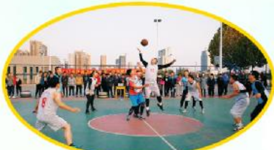
赛场激情