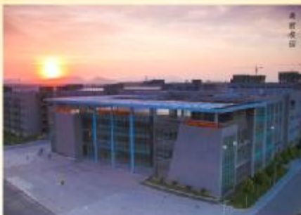
落日余晖映校园