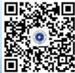
河北机电职业技术学院 官方微信