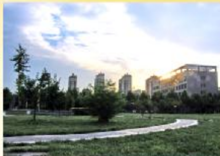
一抹晚霞