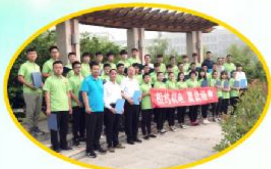
相约机电 晨读经典