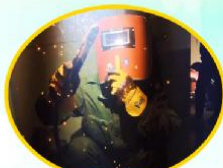
电光火石