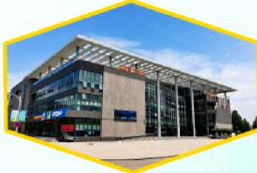
美食餐厅