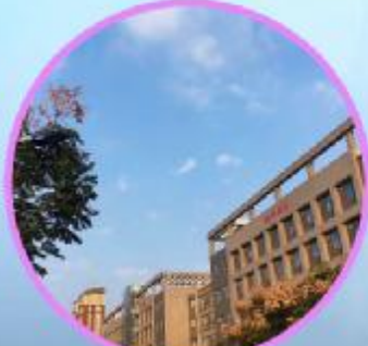
校园初秋