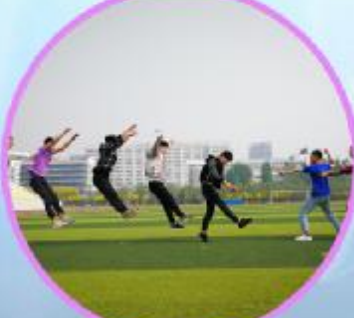
排山倒海