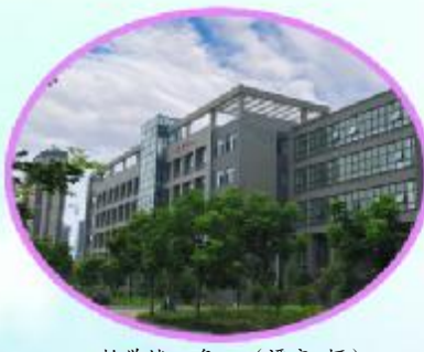
教学楼一角