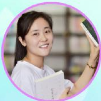
美丽教师