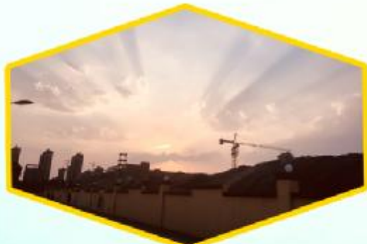
霞光璀璨