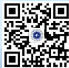
河北机电职业技术学院 官方微博