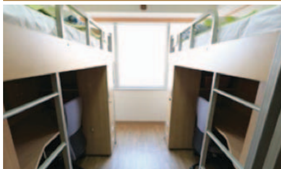
宿舍 (3人间) 房间里