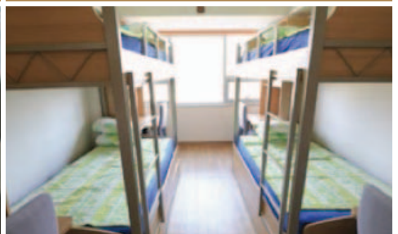
宿舍 (4人间) 房间里