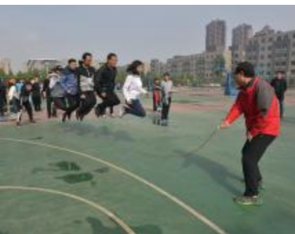
教工趣味项目 - 跳大绳