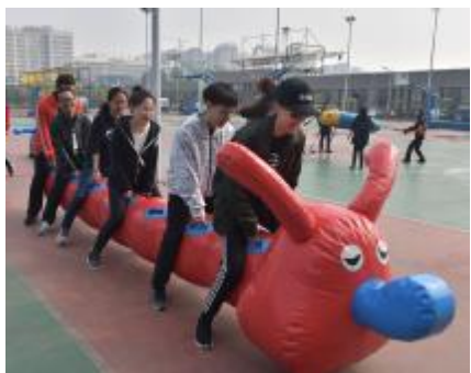
教工趣味项目 - 疯狂毛毛虫