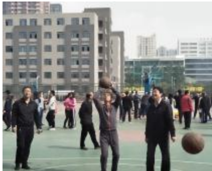
教工趣味项目 - 投篮比赛