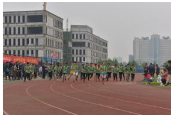
努力拼搏 永争第一